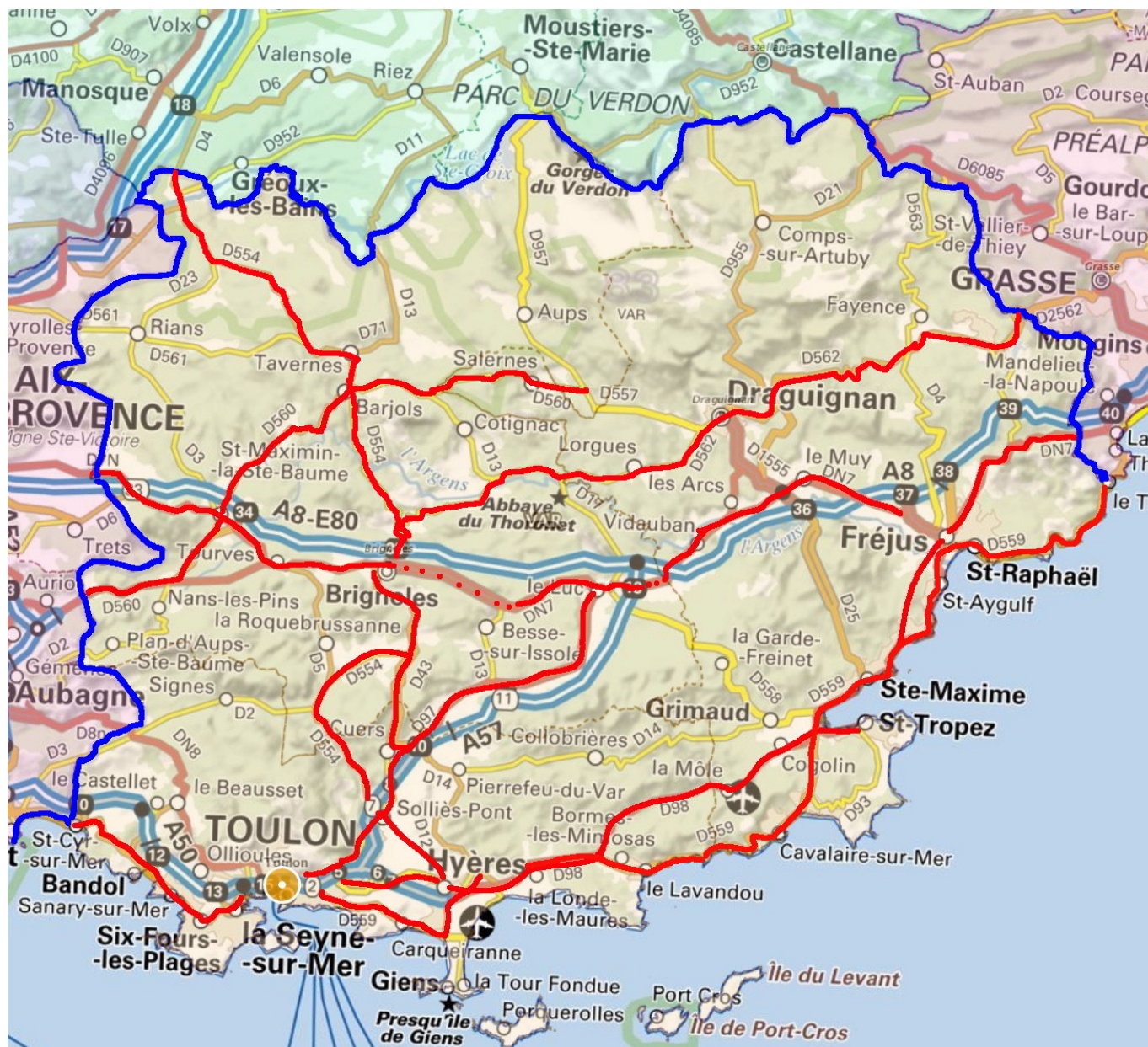
Carte des voies

Les 8 voies où ont été observé le plus de tués, représentant un peu plus de 7% de la longueur totale des routes sans séparateur médian, concentrent 51% des tués.