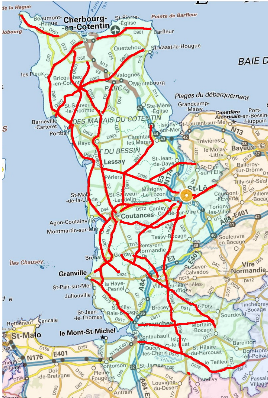
Carte des voies

Les 18 voies où ont été observé le plus de tués, représentant à peine plus de 10% de la longueur totale des routes sans séparateur médian, concentrent 48% des tués.