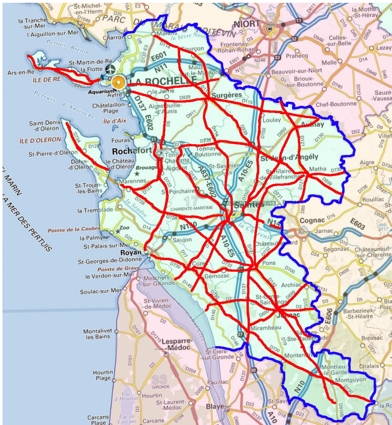
Carte des voies

Les 18 voies où ont été observé le plus de tués, représentant 14% de la longueur totale des routes sans séparateur médian, concentrent 50% des tués.